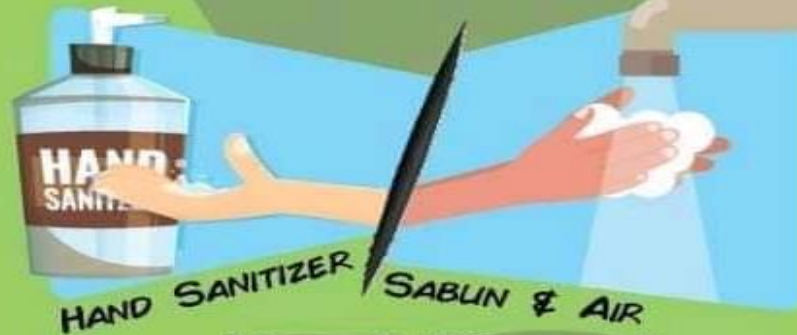
HAND SANITIZER SABUN & AIR

Mengajar anak langkah mencuci tangan dengan betul